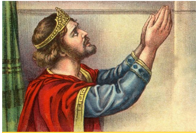
約沙法定意尋求神

約沙法 定意尋求耶和華 ，在猶大全地 宣告禁食 。 那時，耶和華的靈在會中臨到利未人亞薩的後裔—瑪探雅的玄孫， 耶利的曾孫，比拿雅的孫子，撒迦利雅的儿子雅哈悉。 他說：猶大眾人、耶路撒冷的居民，和約沙法王，你們請聽。 耶和華對你們如此說：不要因這大軍恐懼驚惶； 因為勝敗不在乎你們，乃在乎神。